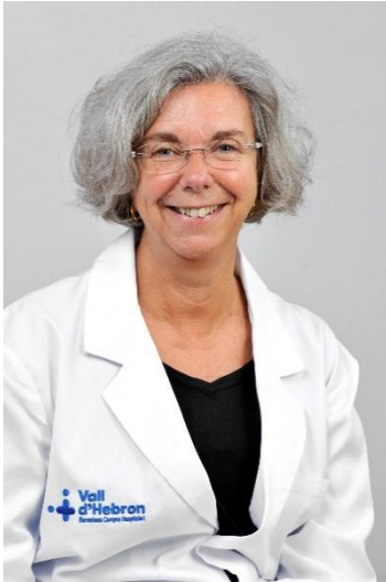
Elena Carreras Hospital Universitari Vall d'Hebron