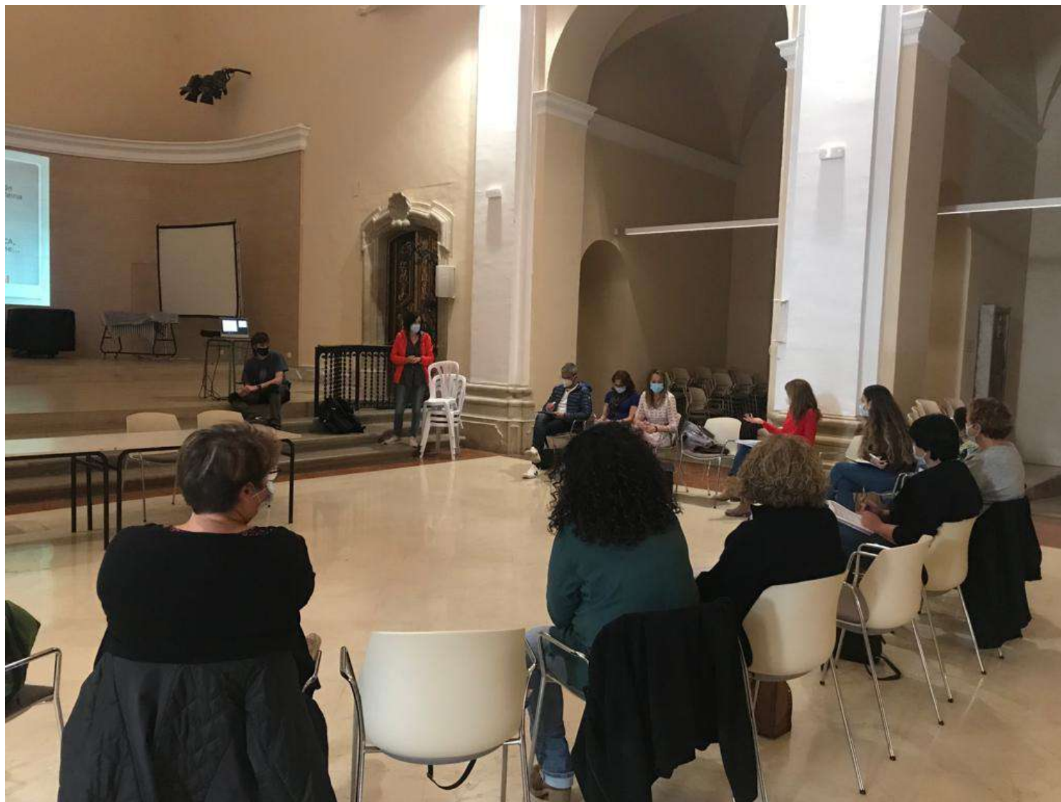
CIRCUIT ATENCIÓ A ADOLESCENTS I FAMÍLIES EN SITUACIÓ DE RISC SEGONS PUNT D'ENTRADA