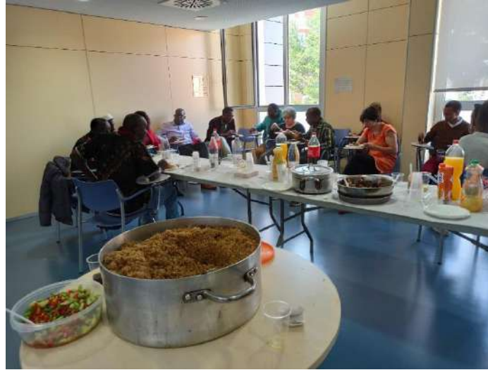
Formació formadors MGF