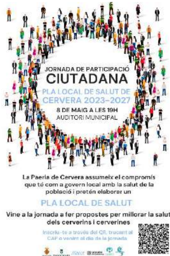
Jornades de participació ciutadana maig 2023