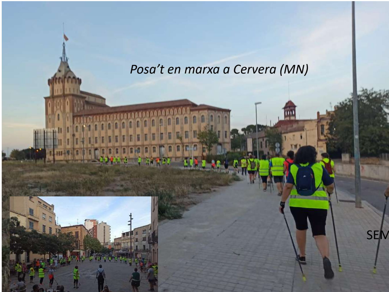
Posa't en marxa a Cervera (MN)