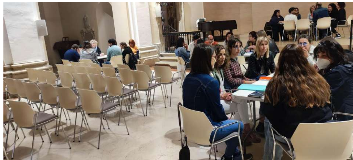
Jornada de participació tècnica maig 2023